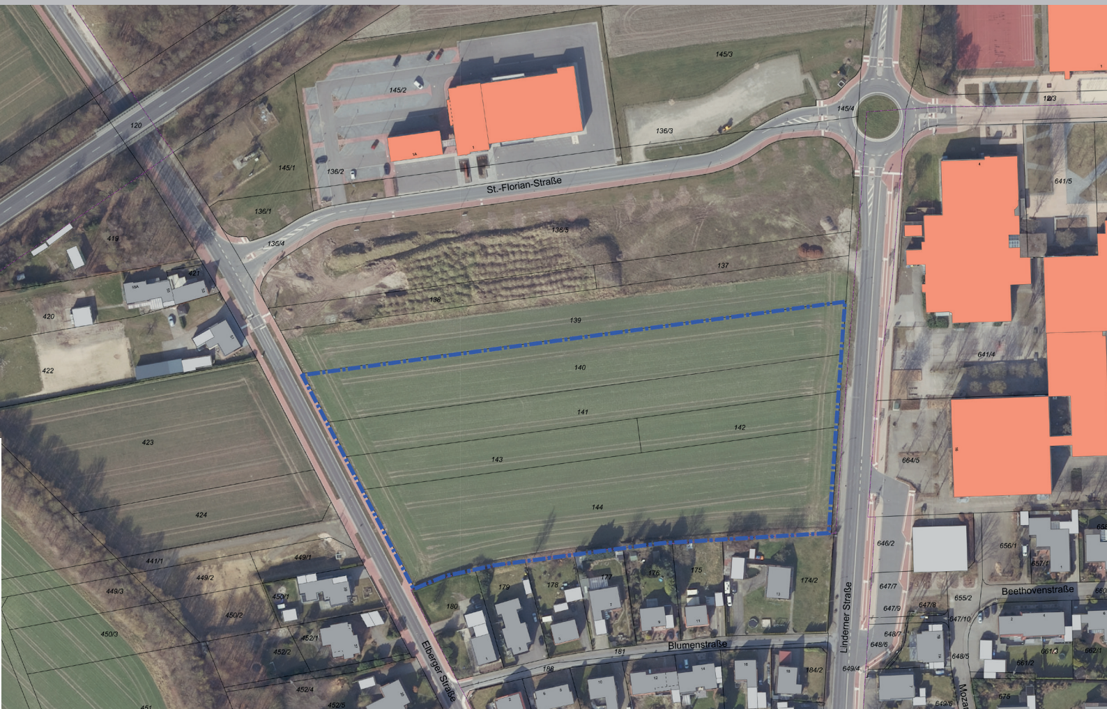
Luftbild, Geoinformationssystem für Kommunen RIWA GIS-Zentrum